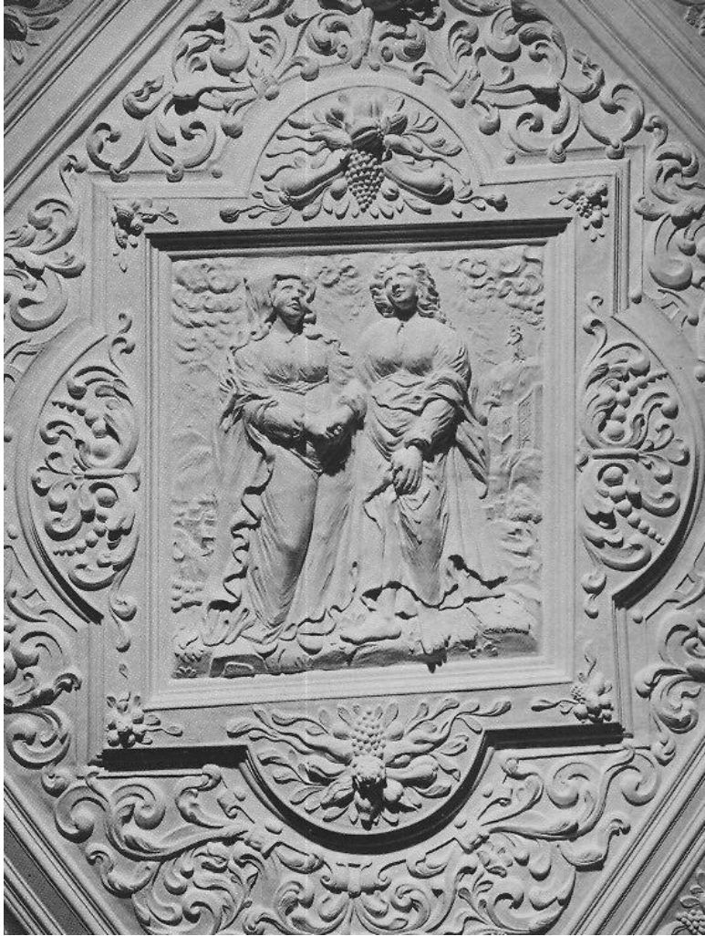
Deckenplastik «Naemi und Ruth» im Haus «Zum Schneeberg» in Schaffhausen, um 1665